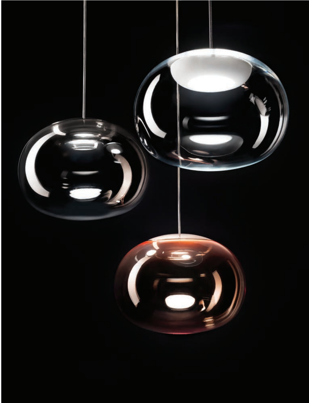
La Mariée pendant luminaires