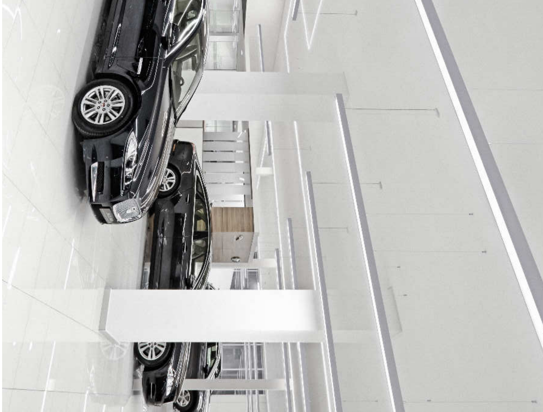
LINE C | PROFILES